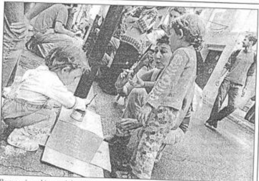
Remue-ménage hier rue de la Méditerranée où le collectif Puls a impulsé un total quartiers libres sur les trottoirs et dans les appartements. Du grand spectacle.