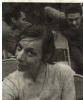
La troupe présentera son spectacle « Liki ».