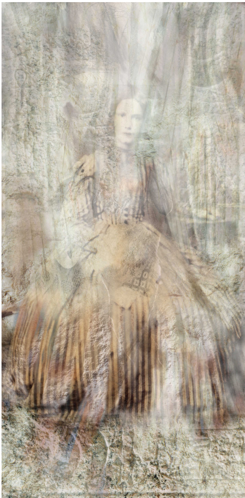
ABITO MUSEALE / MUSEUM DRESS - 2008-2009 - lightbox 98 x 18 x 201 cm