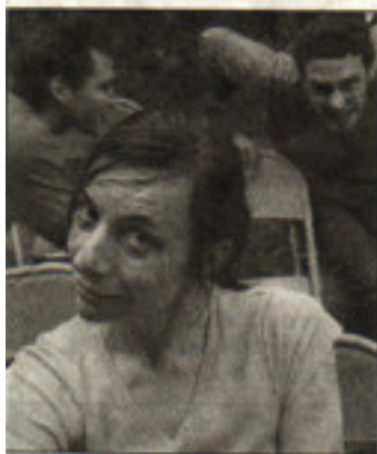
La troupe présentera son spectacle « Liki ».